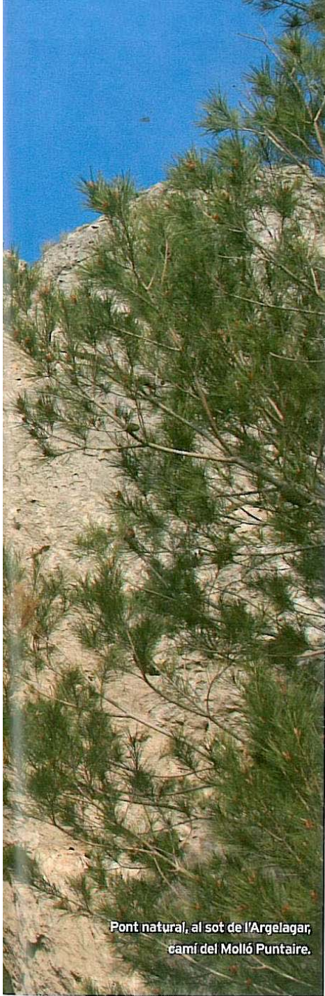
Pont natural, al sot de l'Argelagar, camí del Molló Puntaire.